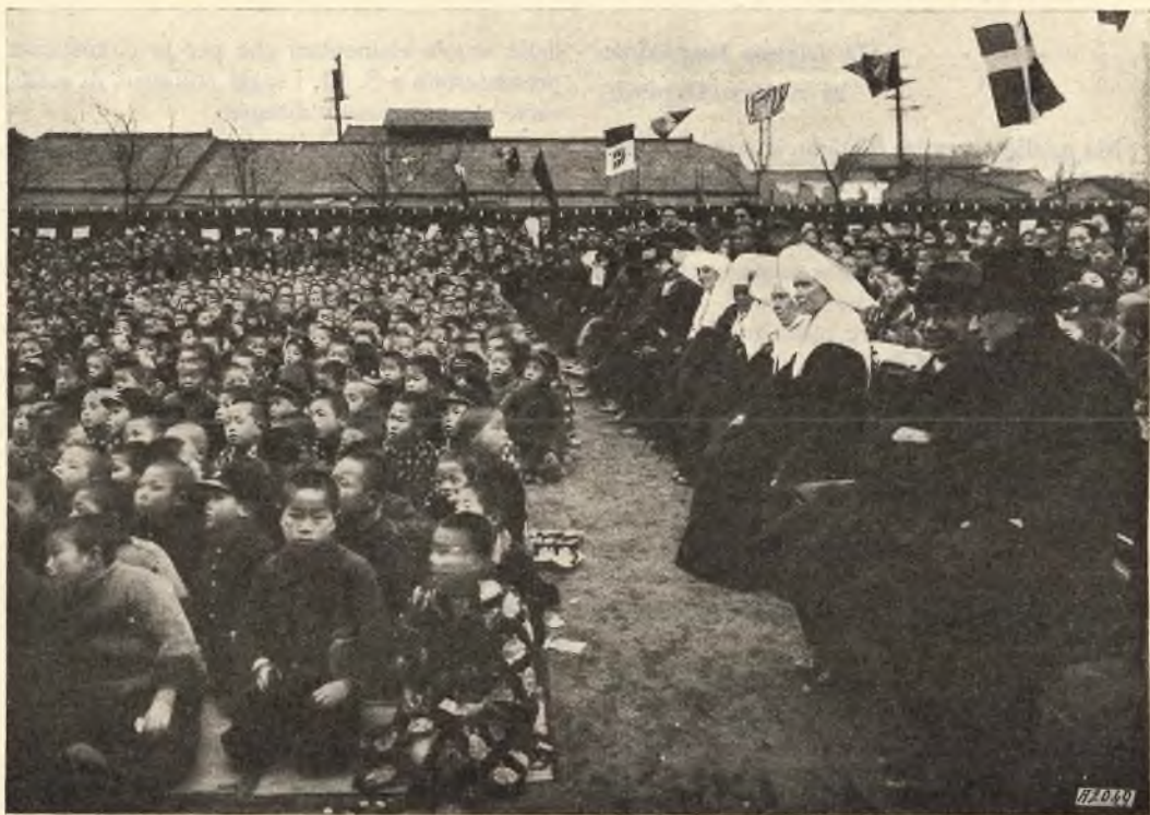
Tokio-Mikawajima. - Folla di bimbi e di adulti, una domenica, nel cortile dell'Oratorio, durante uno spettacolo.