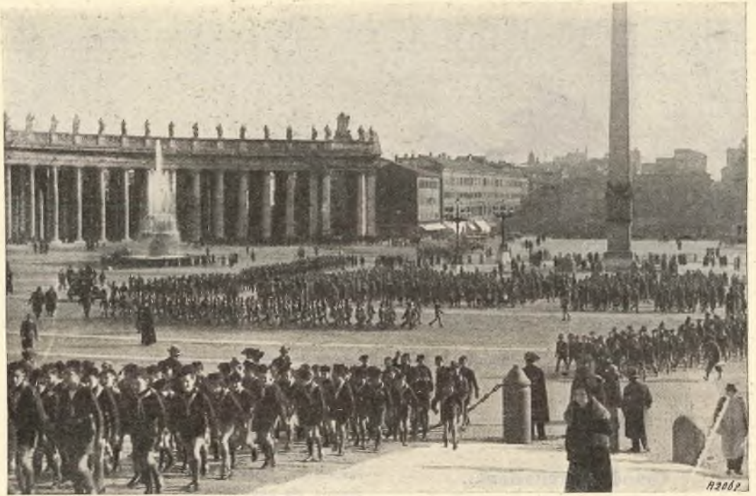
L'ingresso dei 10.000 rappresentanti degli alunni delle scuole di Roma, inquadrati nell'O. N. B.