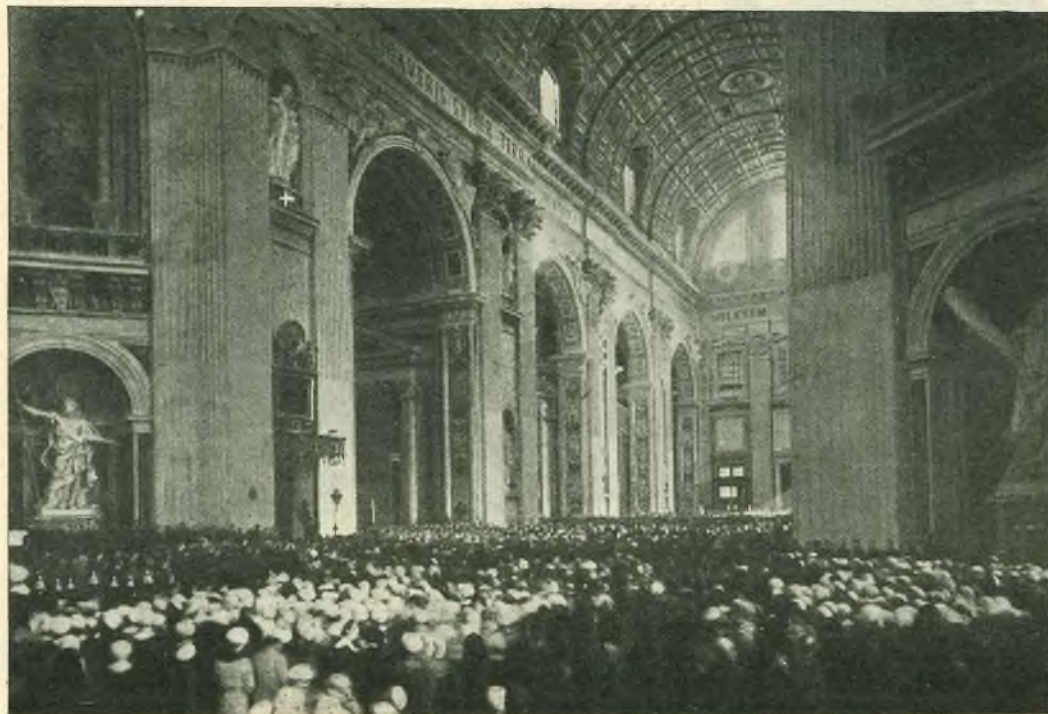
L'immensa folla acclama Don Bosco che appare in alto a sinistra (+) nella nicchia d'onore sopra la statua énea di S. Pietro e il medaglione musivo di Pio IX.