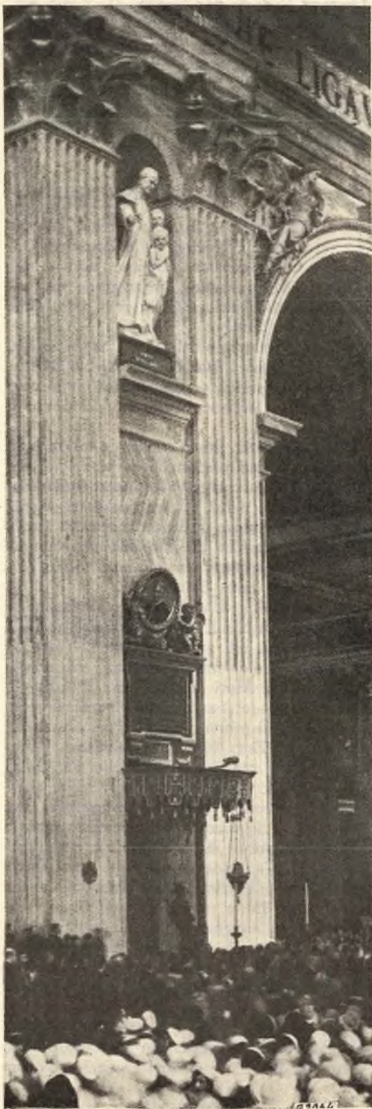
Roma. - Il posto d'onore della statua di Don Bosco: sopra la statua énea di S. Pietro e il medaglione di Pio IX.

fra le tante riservate ai Santi Fondatori di Ordini religiosi ».