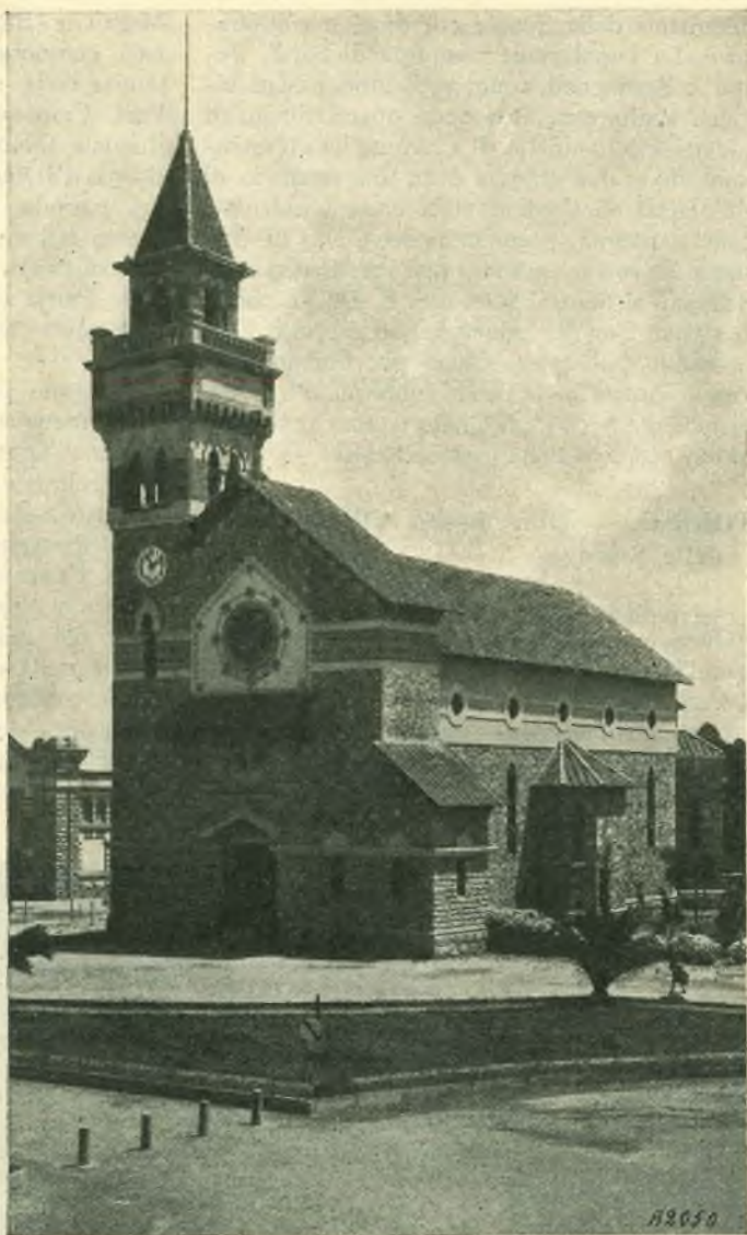
Mussolinia di Sardegna. - La chiesa parrocchiale affidata ai Salesiani.

Chiamati espressamente da S. E. il Capo del Governo, i primi Salesiani hanno raggiunto, domenica 19 gennaio u. s., la città di Mussolinia di Sardegna che anche col nome protesta