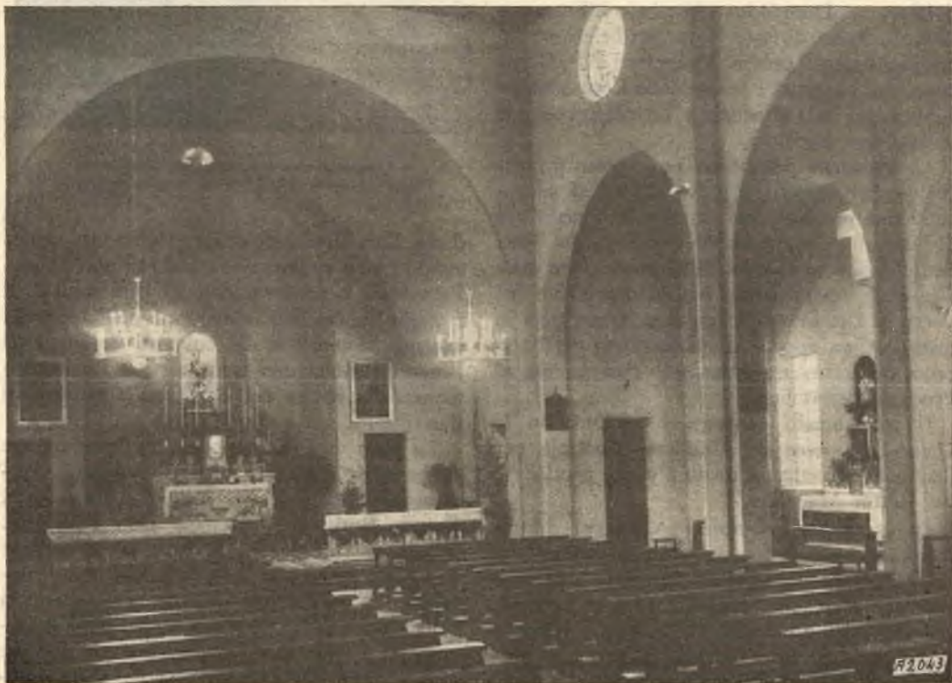
Trento. - La nuova chiesa di Maria Ausiliatrice.