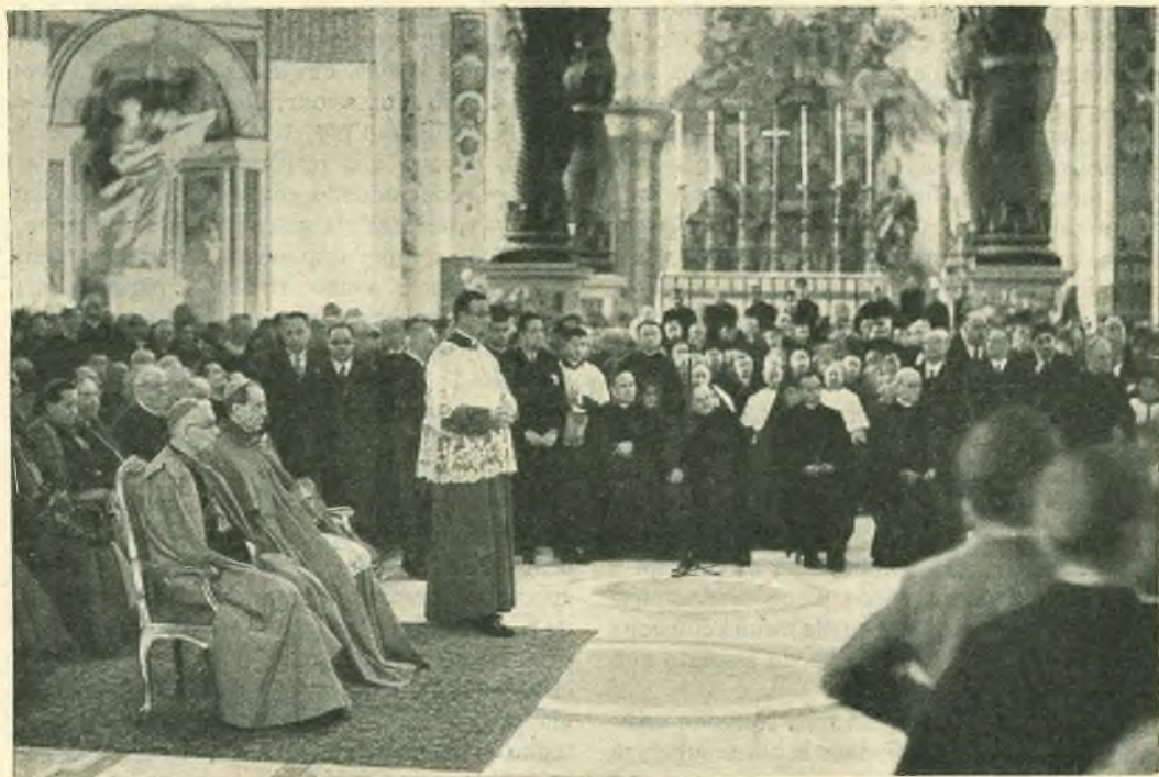
Un'istantanea degli Em.mi Cardinali e dei rappresentanti della Società Salesiana durante le esecuzioni musicali delle nostre "Scholae Cantorum".