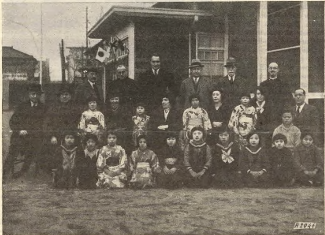
Tokio-Mikawajima. - Ministri di diversi Stati presso il Governo Imperiale, fotografati colle loro Signore dopo la visita al nostro Oratorio.

La Classe di Scienze Morali e Storiche accolse con unanime apprezzamento le conclusioni del relatore, ammirando l'insospettata vastità della cultura storica del Santo, la notevole tendenza alla ricerca scientifica e la superiorità del sentimento d'amor di patria che gli accreditano titoli indiscussi di benemerita nel campo della formazione dell'Italia moderna.