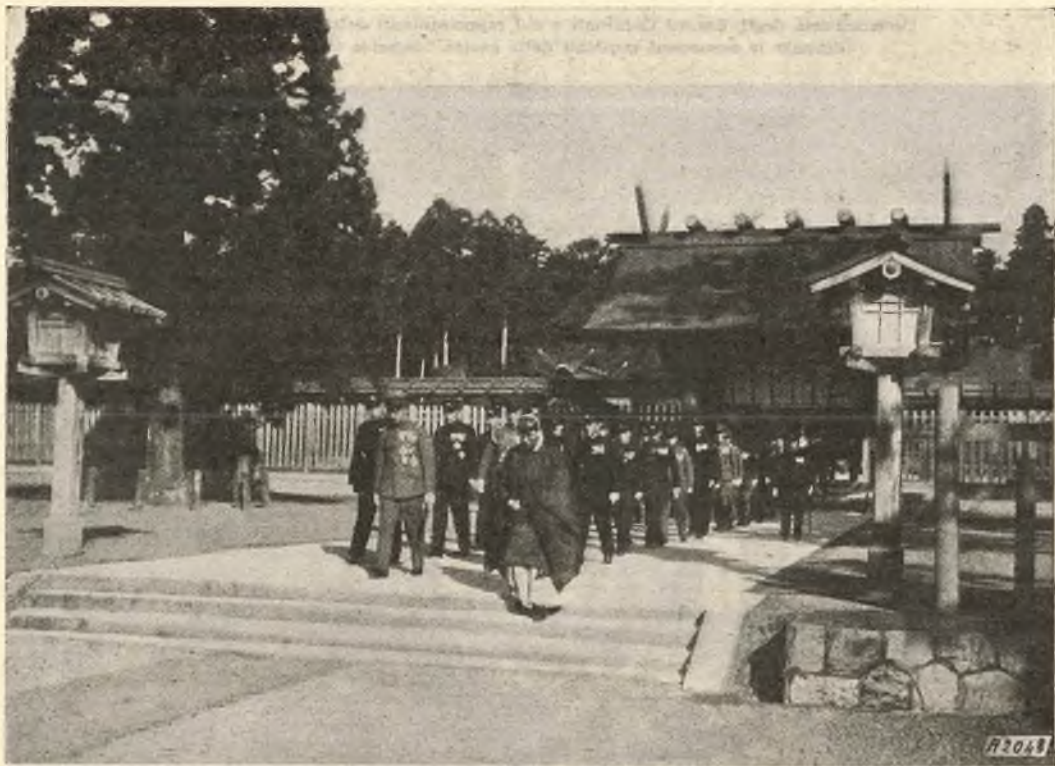
Miyazaki. - S. M. l'Imperatore esce dal tempio di Jimnu.