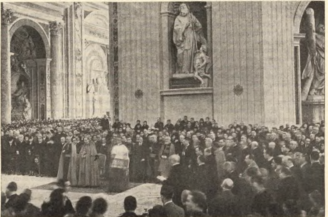
L'inizio della cerimonia alla presenza degli Em.mi Signori Cardinali Eugenio Pacelli e Carlo Salotti Ecc.mi Arcivescovi e Vescovi. Corpo Diplomatico, Autorità, personalità e immensa folla.