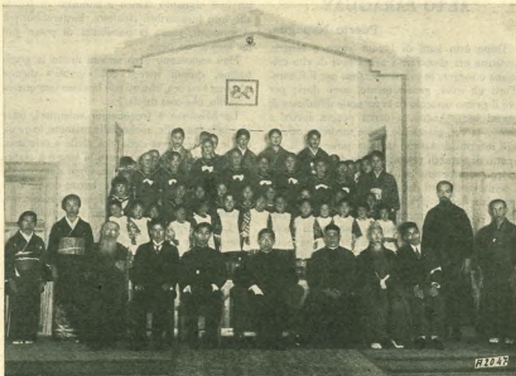
Miyazaki. - Il Rappresentante di S. M. l'Imperatore in visita al nostro Ospizio.